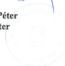
Dr. Hanusi Péter polgármester

A handwritten signature in blue ink, appearing to be 'JG' followed by a stylized flourish.